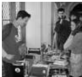
Żywe zainteresowanie na stoisku z książkami