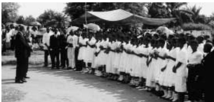
Konfirmanci śpiewem witają apostoła okręgowego w Kanandze