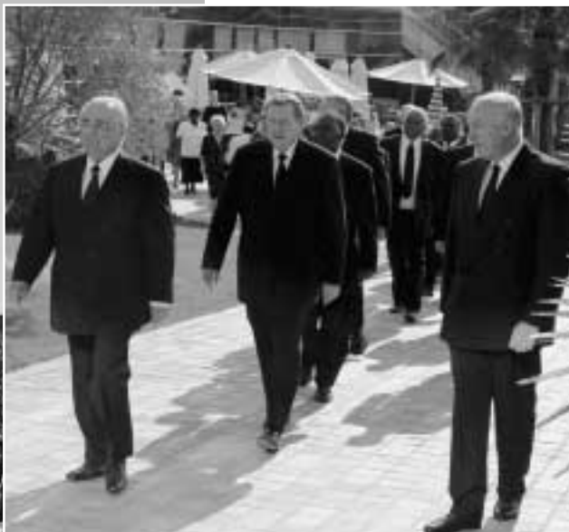
W drodze do Espace Congres na nabożeństwo