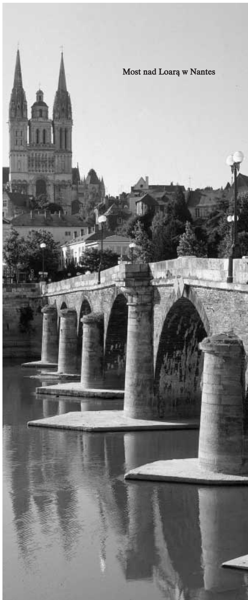
Most nad Loarą w Nantes