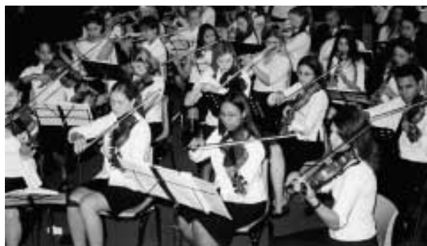
Orkiestra podczas nabożeństwa dla młodzieży