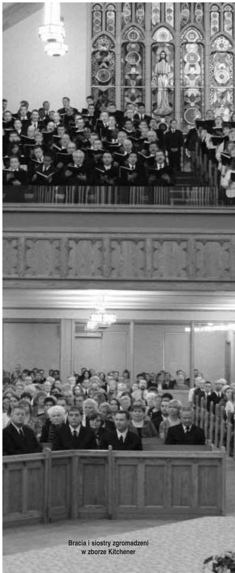
Bracia i siostry zgromadzeni w zborze Kitchener