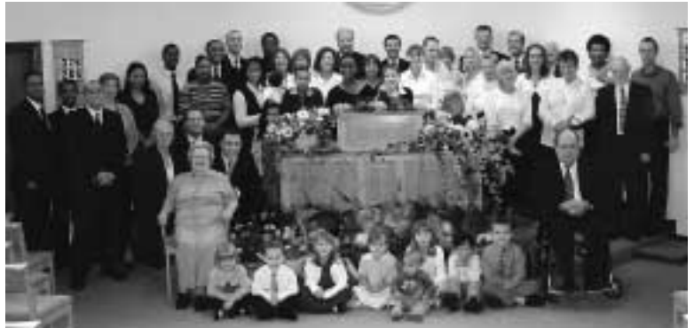
Bracia i siostry ze zboru Camberley ustawili się do zdjęcia grupowego przy ołtarzu przystrojonym na nabożeństwo ofiarno-dziękczynne

Wielka Brytania: Bracia i siostry ze zboru Camberley wspólnie przygotowali dzień ofiarno-dziękczynny. W sobotę 2 października ub.r. gruntownie wysprzątały kościół, uporządkowały posesję kościelną i przystroili ołtarz. Na nabożeństwo niedzielne, 3 października, przybyło 46 braci i sióstr oraz 7 gości. Po nabożeństwie bracia i siostry odwiedzili miejscowy ośrodek opieki społecznej i przekazali wielki kosz owoców. Dzień ofiarno-dziękczynny zakończył się wieczornym spotkaniem w gronie braci i sióstr.