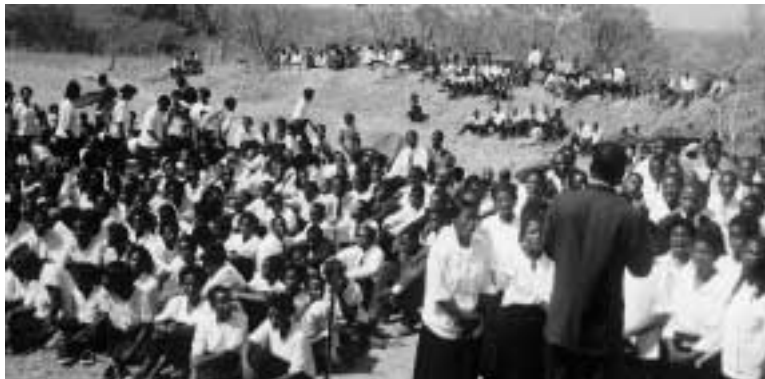
Jedna z wielu prób chóru podczas spotkania młodzieży w Kabompo