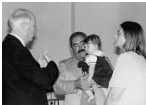
Chrzest wodny i pieczętowanie w Oristano