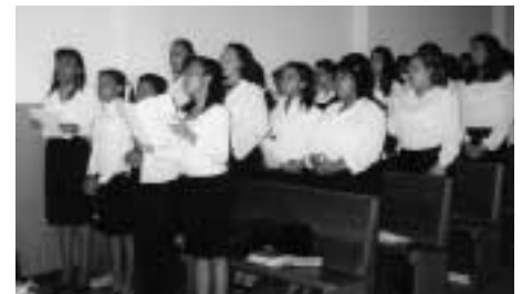
Chór pewnego zboru w Wenezueli