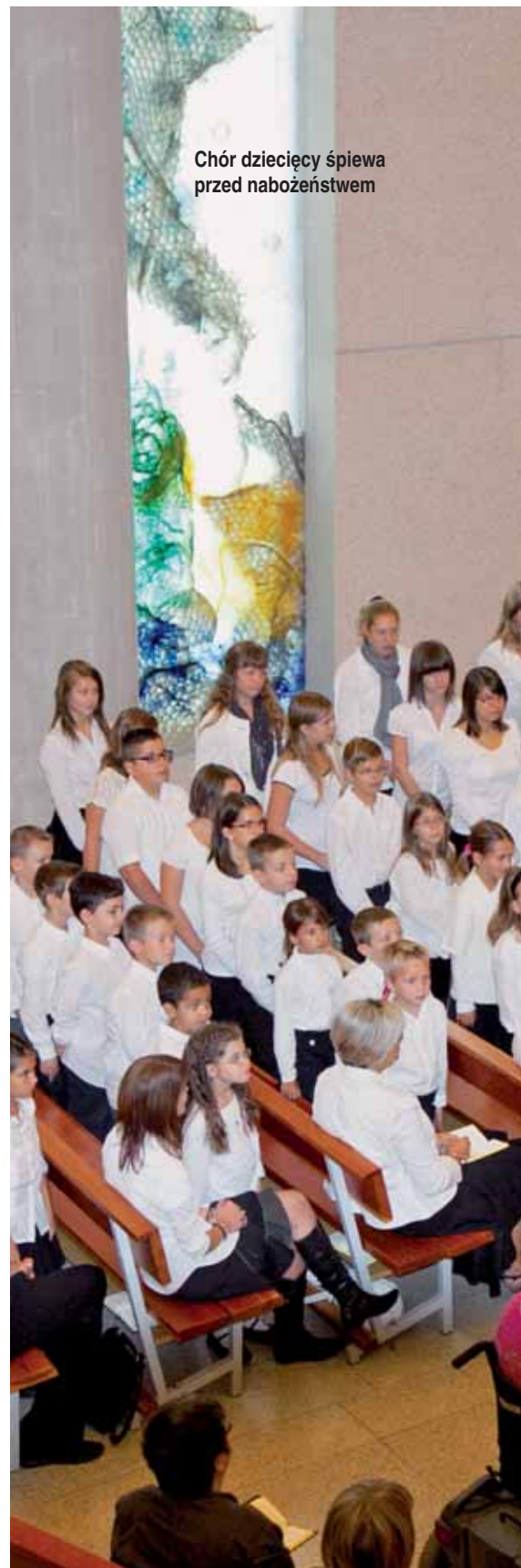
Chór dziecięcy śpiewa przed nabożeństwem