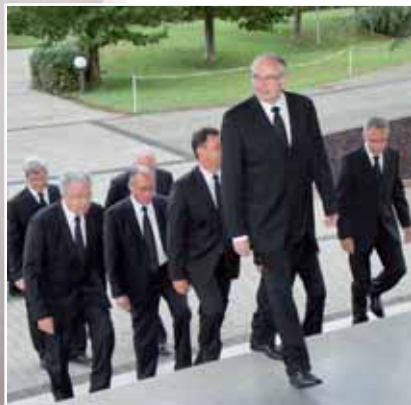
Główny Apostoł i towarzyszący mu apostołowie wchodzą do kościoła w Metz